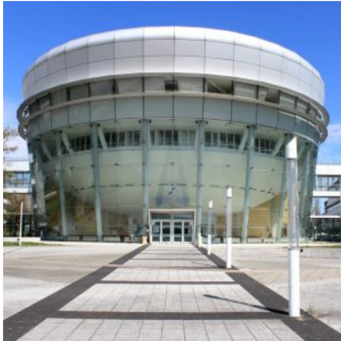
Télécom Physique Strasbourg, l'école où se déroulera la conférence

C'est justement sur ce dernier point que se base la conférence 4.0 organisée par Alsace Tech et la CCI Alsace Eurométropole ce mardi 9 mai. Ayant pour but de répondre à la question « Comment intégrer de nouveaux dispositifs intelligents dans les équipements industriels pour apporter une meilleure réponse Client ? », cette conférence (ou plutôt conférence-débat) proposera 4 interventions des entreprises HYPROMAT, DIGORA, d'un enseignant chercheur de Télécom Physique Strasbourg ainsi que d'une table ronde. La conférence aura donc lieu le 9 mai dans l'amphithéâtre de l'école d'ingénieur Télécom Physique Strasbourg (Pôle API, 300 Bd Sébastien Brant, 67400 Illkirch-Graffenstaden). Notez toutefois qu' il est nécessaire de s'inscrire sur ce site internet (rassurez-vous, l'inscription est gratuite mais obligatoire). Le programme sera donc le suivant :