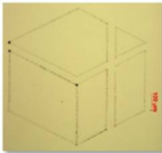
Légende : Gravure du logo ICube via la station de gravure sub-micron par jet photonique

coopérations recherche. La station de gravure a reçu le premier prix d'innovation du Photonics Innovation Village de Photonics Europe à Bruxelles en 2016.