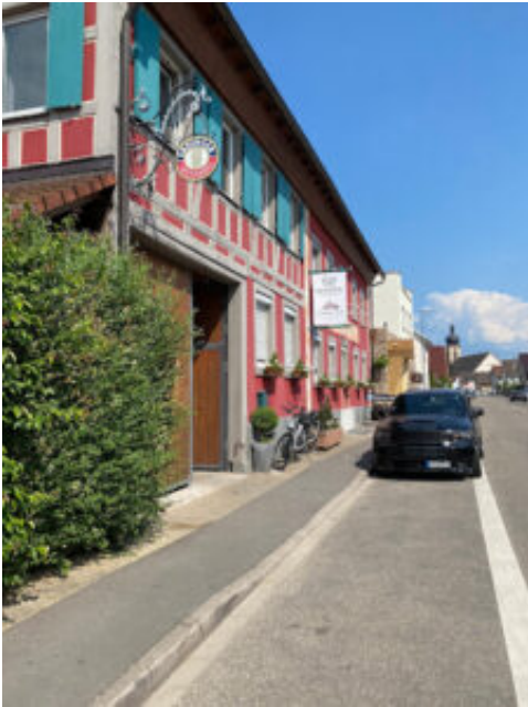
Elsässer Hof Kappel-Grafenhausen