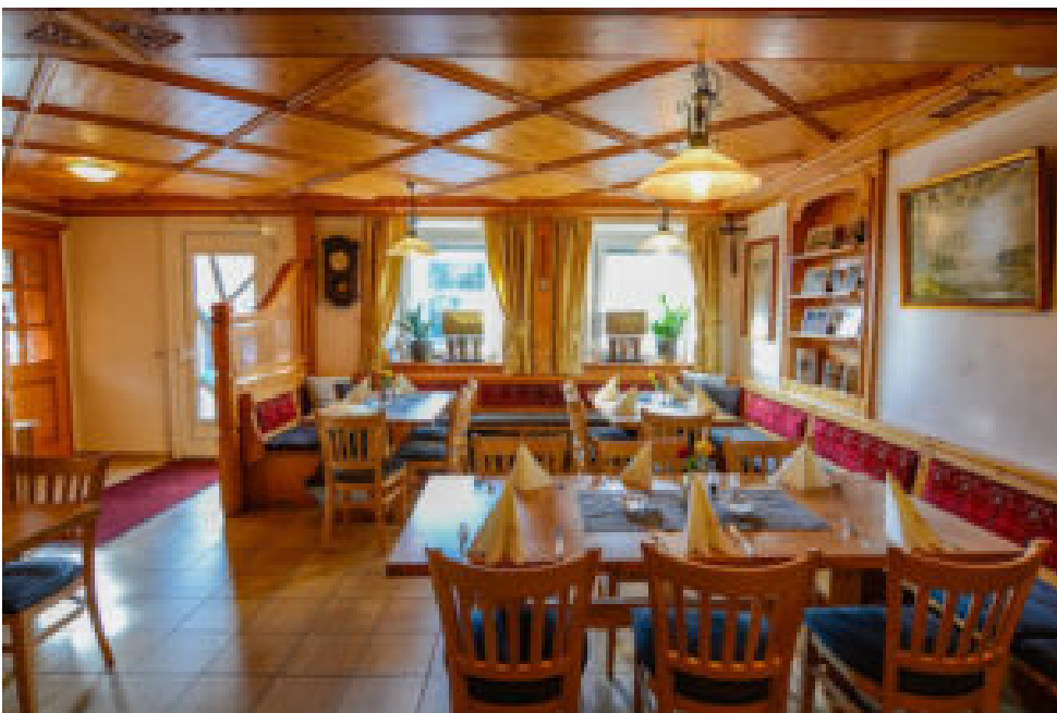
Elsässer Hof Kappel-Grafenhausen